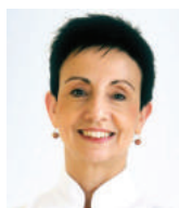
CARME RUSCALLEDA SANT PAU Espagne