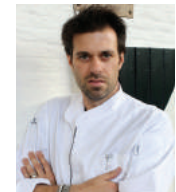
SERGIO HERMAN THE JANE Belgique