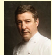
JOAN ROCA EL CELLER DE CAN ROCA Espagne