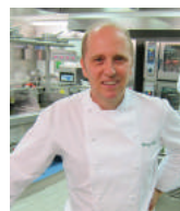
HEINZ BECK LA PERGOLA Italie