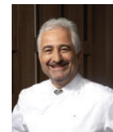
GUY SAVOY Rest. GUY SAVOY France