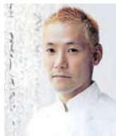
KEI KOBAYASHI Rest. KEI France