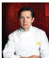
HEINZ REITBAUER STEIERECK Autriche