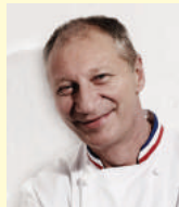
ERIC FRECHON EPICURE France