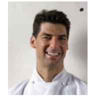
MASSIMILIANO ALAJMO LE CALANDRE Italie