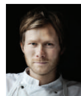
RASMUS KOFOED GERANIUM Danemark