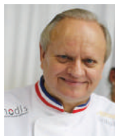
JOEL ROBUCHON L'ATELIER DE JOEL ROBUCHON - France