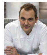
DANIEL HUMM ELEVEN MADISON PARK USA