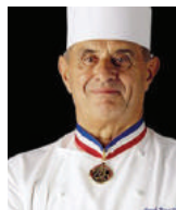
PAUL BOCUSE Rest. PAUL BOCUSE France