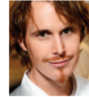
GRANT ACHATZ ALINEA USA