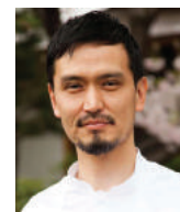
SHINOBU NAMAЕ L'EFFERVESCENCE Japon