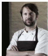
RENE REDZEPI NOMA Danemark