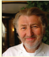
PIERRE GAGNAIRE Rest. PIERRE GAGNAIRE France