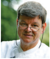
HARALD WOHLFAHRT SCHWARZWALDSTUBE Allemagne