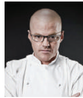
HESTON BLUMENTHAL THE FAT DUCK Royaume-Uni