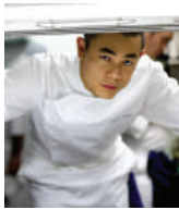
ANDRE CHIANG Rest. ANDRE Singapour