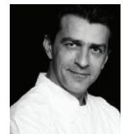
YANNICK ALLENO LEDOYEN France