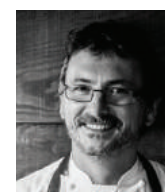
ANDONI LUIS ADURIZ MUGARITZ Espagne