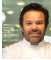
MICHEL TROISGROS Rest. TROISGROS France