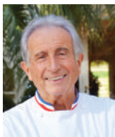
MICHEL GUÉRARD LES PRÈS D'EUGÉNIE France