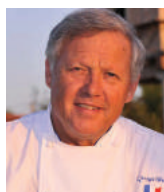
GEORGES BLANC Rest. GEORGES BLANC France