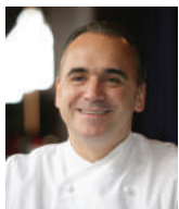
JEAN-GEORGES VONGERICHTEN Rest. JEAN-GEORGES - USA