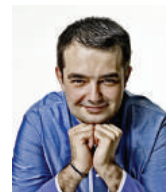
JEAN-FRANCOIS PIEGE LE GRAND RESTAURANT France