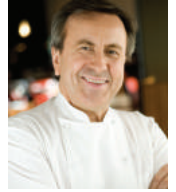
DANIEL BOULUD Rest. DANIEL BOULUD USA