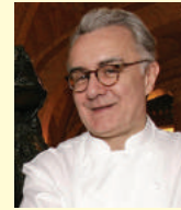
ALAIN DUCASSE LOUIS XV ALAIN DUCASSE Monaco