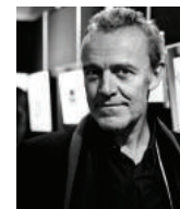
ALAIN PASSARD L'ARPEGE France