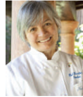
NADIA SANTINI DAL PESCATORE Italie